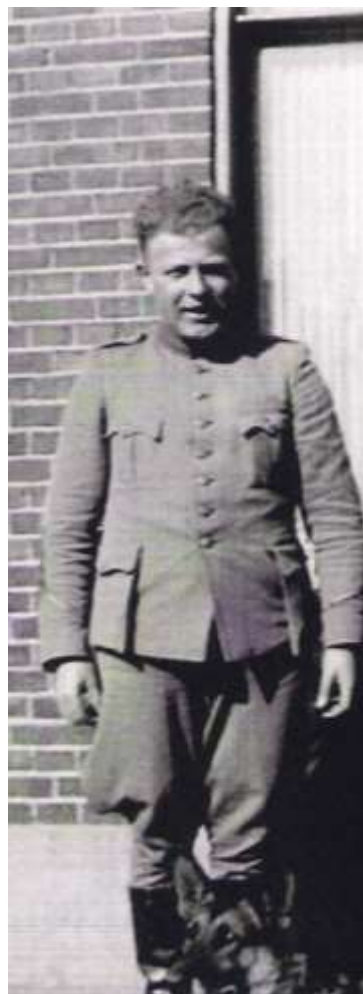
en in dienst ca. 1930