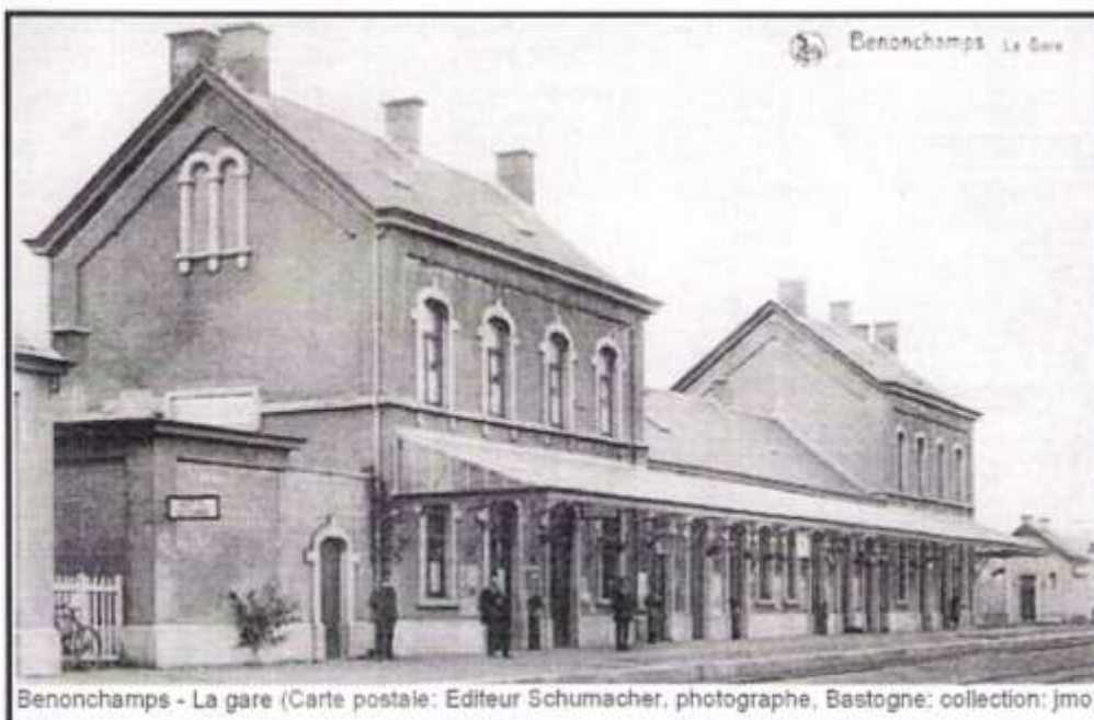
Benonchamps - La gare

Schenk hem, Heer, en aan allen die in Christus rusten, de plaats van verkwikking, rust en vrede.